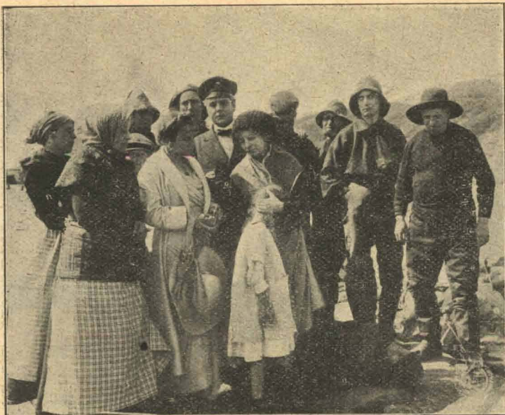
Sorg i Fiskerlejet.

død, og hun plages af uhyggelige Anelser om Sorger, som Fremtiden vil bringe. Hendes Mand gør alt for at berolige hende og gøre hende forstaaeligt, at Egil Bryde forlængst vilde have givet Livstegn fra sig, hvis han ikke var omkommen. Merete ser godt, at hendes Mands Ræsonnement er rigtig, — men hun kan alligevel ikke blive den Angst og Tvivl kvit, som nu engang har bemægtiget sig hendes Sind. Hun bliver nervøs og kommer til at lide af Søvnløshed — og Huslægen tilraader derfor hendes Mand at rejse med hende til det kendte Kursted „Seebrunnen“. John Ferry følger Lægens Raad, og han og Merete begiver sig til Kurstedet, der ligger i Nærheden af det Fiskerleje, hvor Egil Bryde opholder sig . . . . En Dag foretager Ægteparret en Sejl tur over til Fiskerlejet, — og Egil Bryde ser Merete, som imidlertid ikke lægger Mærke til ham. Synet af hende vækker nogle taagede Forestillinger om Fortiden til Live i den ulykkelige Mands Hjerne, og dette bevirker, at han næste Dag tager over til Kurstedet. Her finder netop en improviseret Fest Sted til Fordel for