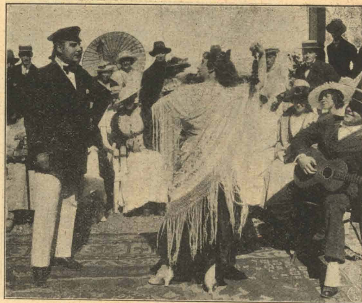
Kastagnetter og Guitar.

en druknet Fiskers Efterladte, — og Merete, der nu omtrent er blevet helt rask, medvirker. Egil Bryde ser hende danse nogle spanske Danse, som hun i sin Tid har danset for ham, — og pludselig vender hans Hukommelse tilbage. Han styrter med et Jubelskrig hen til hende, — men saasnart hun faar Øje paa ham, synker hun afmægtig om . . . . Hun bliver bragt til Sengs — og først nu faar Egil Bryde at vide, at hun er gift med hans forhenværende Reder. Han opsøger denne, fortæller ham sin Historie og erklærer, at han ikke vil give Afkald paa Merete, som han stadig elsker. John Ferry søger at gøre ham indlysende, at han vil handle urigtigt i at bringe ham og Merete fra hinanden. Hun har ikke kunnet tro andet, end at hendes første Mand var død og har nu — efter mange tunge og bitre Timer — omsider fundet Lykken ved en anden Mands Side . . . . Og Egil Bryde faar Lejlighed til at konstatere Sandheden af den andens Ord, — og han forstaaer, at Merete virkelig er tabt for ham — og gaar saa, uden at gøre Forsøg paa at nærme sig hende. Halvt fra Sans og Samling strejfer