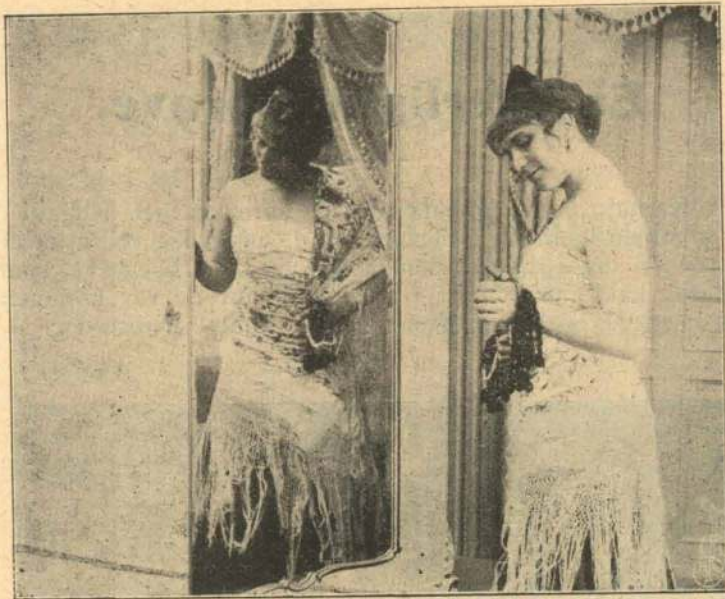
I den spanske Dragt.

— — — Nogle Maaneder senere modtager John Ferry et Telegram, hvori det meddeles, at „Gigant“ er gaaet under med Mand og Mus lige efter at være tiltraadt Hjemrejsen. Rederens første Tanke gælder Merete, og han gribes af den dybeste Medlidenhed med den unge Kone, der saa kort efter sit Giftermaal har mistet sin Ægtefælle. Han opsøger hende og meddeler hende i skaansomme Ord Ulykkesbudskabet. Den ulykkelige Kvinde kan ikke fatte, at Skæbnen kan have været saa haard og ubarmhjærtig mod hende, at den kan have berøvet hende den Mand, hun nylig har viet sit Liv til, — men meget snart forstaar hun, at der ikke kan være Tvivl om, at han er omkommen, — og fortvivlet synker hun sammen . . . . . Egil Bryde har dog ikke fundet sin Død i Bølgerne. Han er blevet skyllet op paa Klipperne ved St. Jules, i Nærheden af hvilken Skibbruddet fandt Sted, og er bleven funden af nogle Fiskere, der har sørget for, at den forkomne og forslaaede Mand har faaet en omhyggelig Pleje . . . . Det varer da heller ikke længe, før han kommer til Kræfter igen; — men hans Forstand er